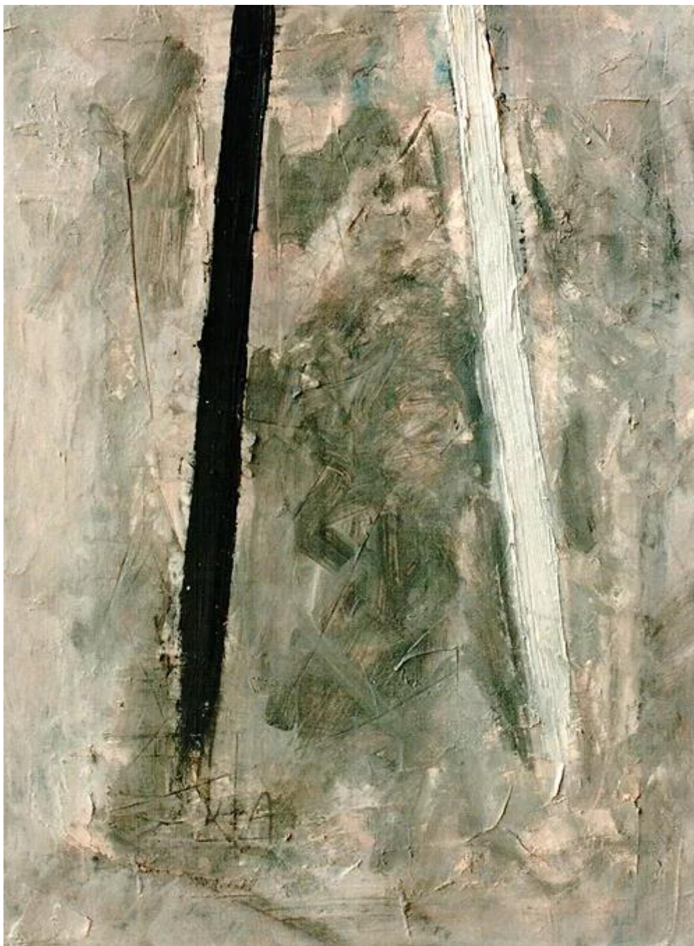
Two lines, 1997, olaj, vászon, 40 cm x 30 cm

Belép egy újabb dimenzió. A színek. És a faktúra életre kel. Mégis, a törvény tisztaságához képest mindez esendőbb. Valahogyan emberi. Úgy emberi, hogy esendőségében mégis szerves, még romlatlan, elemi önreflexió.