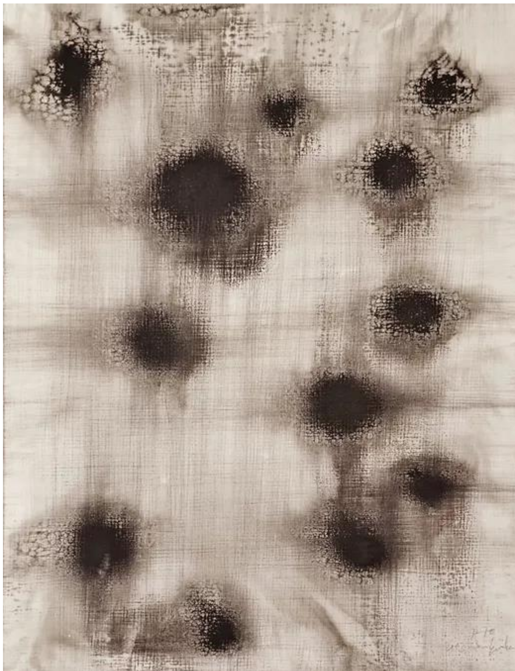
Fleck flumina, 2013, tinta, papír, 62,5 cm x 48 cm

Mennyire más világ van ebben a képben az előzőekhez képest! Azt a világot is lehetne még a végtelenségig tágítani, itt azonban egy másik világ más érvényű viszonyrendszere tárul fel. Egy elementáris vizuális képlet.