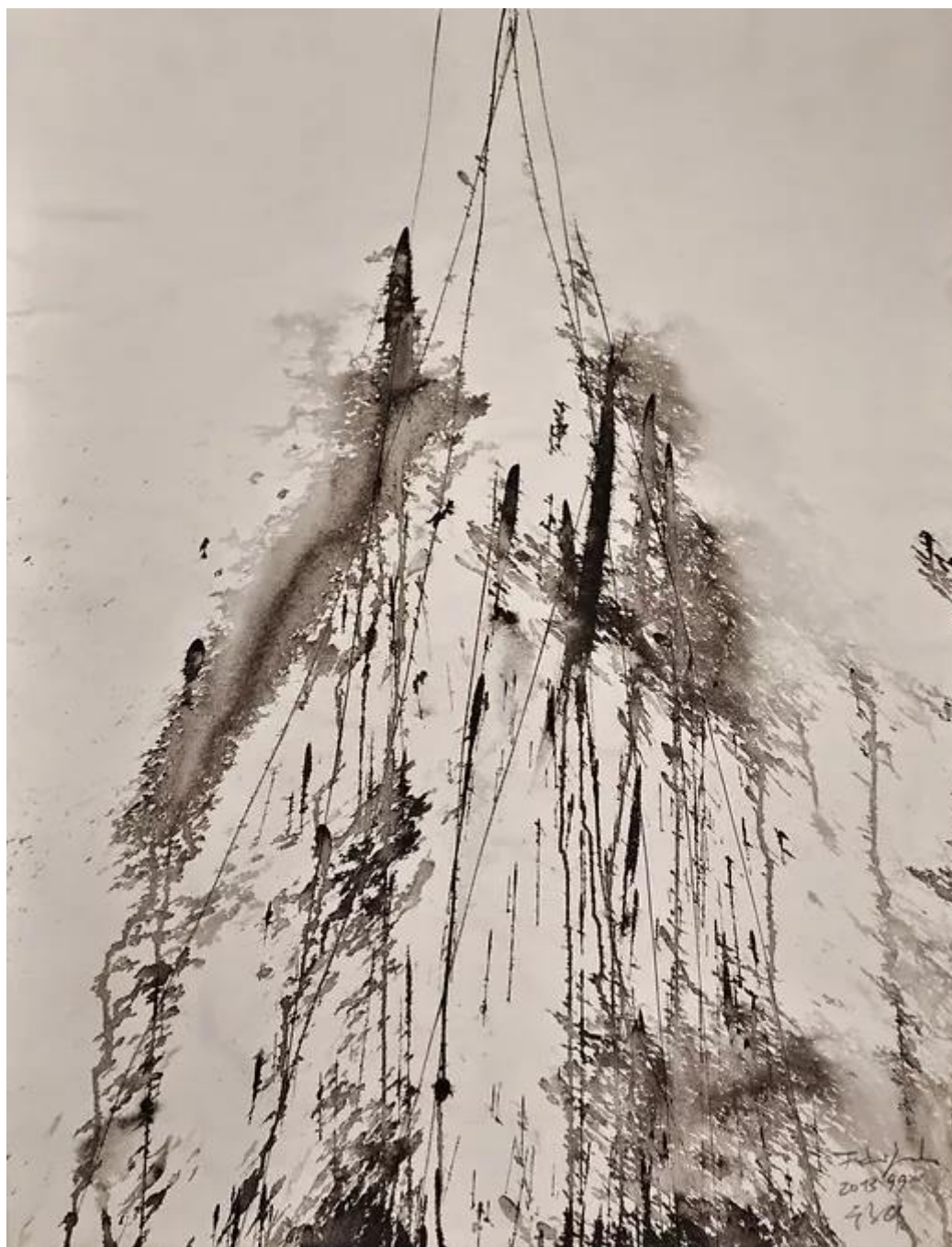
Untitled, 2013, tinta, papír, 62,5 cm x 48 cm

Főként a sorozatokban követhetők a mélységi behatolás fázisai. – Vagy egy adott, elvont vízió körüljárása. Mindez szöveggel, reprodukciókkal csak közvetetten érzékeltethető. Olyasmi, mintha zenéről akarnánk beszélni – annál is inkább, mert ezek a képek leginkább zenei hangzatokkal rokoníthatók. Ráadásul nagyon fontosak a finom árnyalatok. Megfelelő kiállító tér kellene, megfelelő megvilágítás és meditatív nyugalom. Akkor elkezdjük látni a felfelé törő szerves struktúra elevenségét. Az élet egy lehetséges ősgondolatát. Azután ott van a lefelé zuhogó víz.