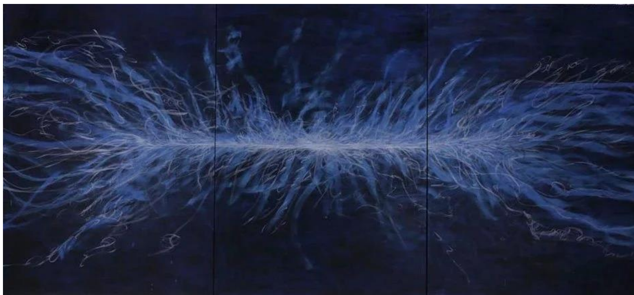
Tesla-Rai Jin (tryptich), 2015, olaj, vászon, 480 cm x 228 cm

A Tesla-sorozat mindenképp egy kitérő a konzekvensen felépített látványvilághoz képest. Itt hangsúlyosan érzékeljük a „beavatkozást”. Azt a beavatkozást, ami „olyan” akar lenni, de nem az. Megjelenik benne a szervesetlen. Az avatatlan ember szervesetlensége.