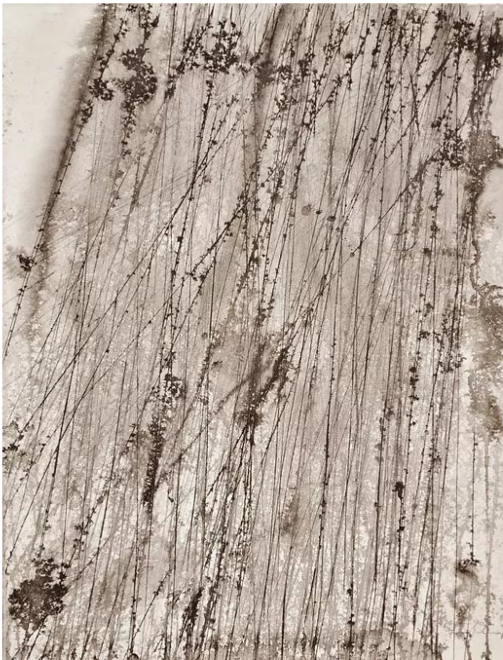
Rain, 2013, tinta, papír, 62,5 cm x 48 cm

Sem nem kell a látványhoz a cím, sem nem zavaró a látványnak ez a cím. (Rain) Mert a képen a víz lefelé zuhog, és talán épp eső. De több mint eső, mert esővé csak ezután, az időbe belépve manifesztálódik.