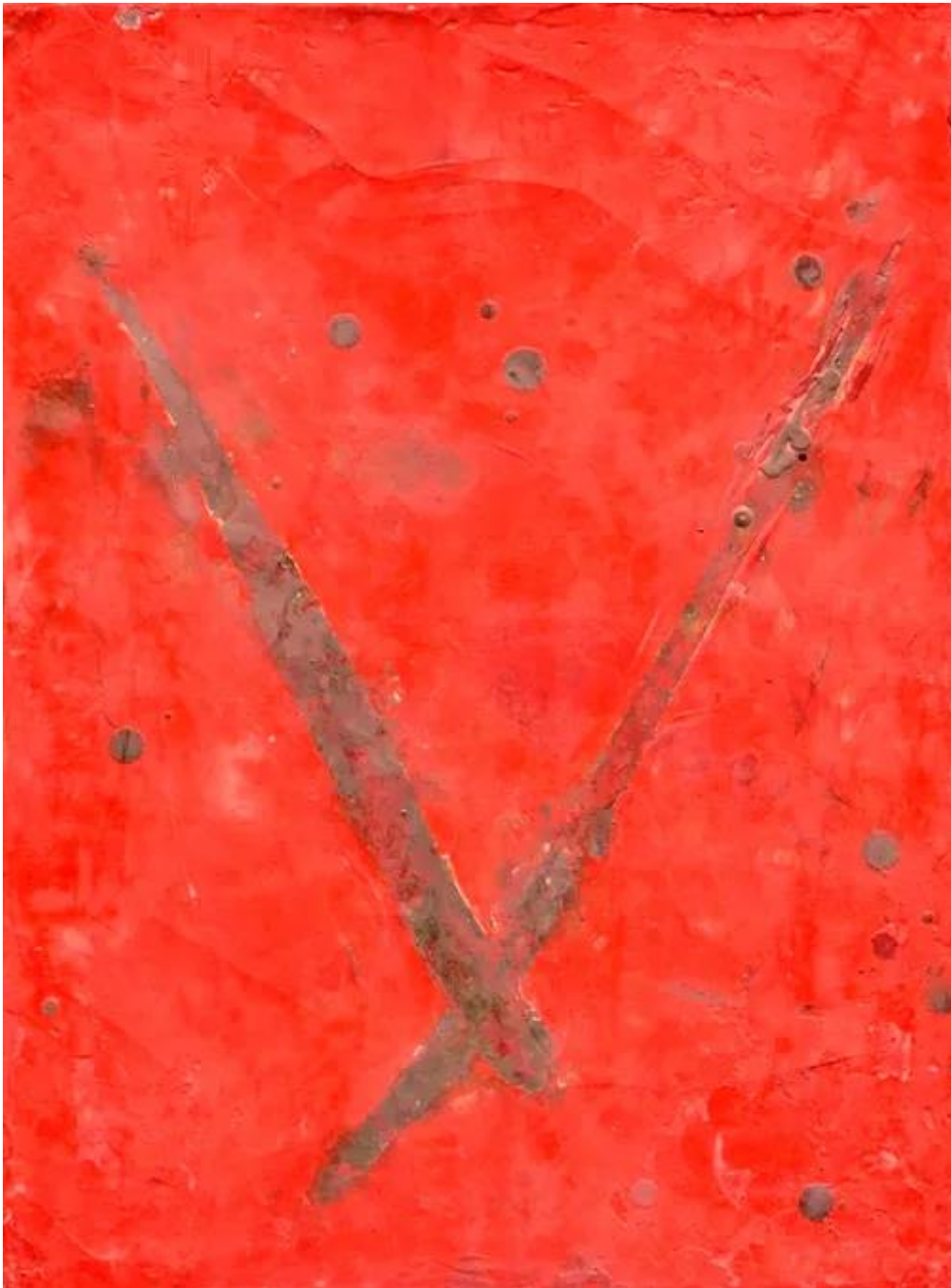
Target (Red), 1999, vegyes technika, 40 cm x 30 cm

Egyedül ennél a képnél – valahogy ennél a képnél nem kellett volna cím. Ez a cím. Mert a Target konkrét. A kép nem konkrét. Sokkal inkább a konkréttá válás előtti állapot, ahol már vannak viszonyítási pontok. Ahol már megjelenik az értelmezhetőség ígérete. De még előtte vagyunk. Már van tér, amorf tér, ami hordozza a magába foglalás képességét, és meg is jelenik benne valamiféle differenciálódás, esetlegesen, rendezetlen pontokként, kezdetleges formai rendezettségre utalásként. Az időbe belépés pillanata.