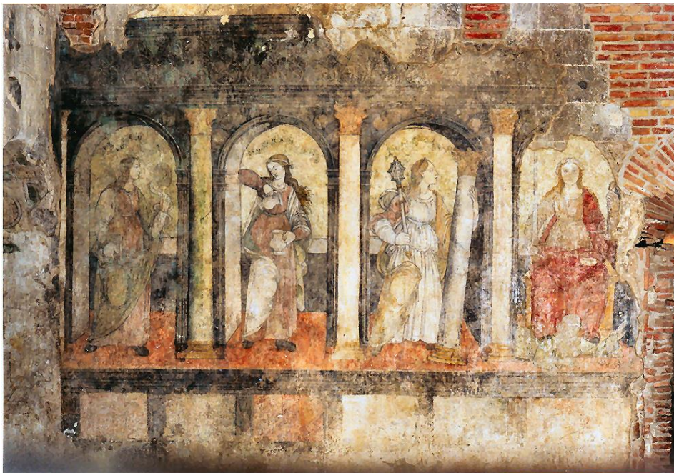
3.kép: A Négy sarkalatos erény allegóriája, freskó, Botticelli, Johannes Vitéz Studiólójában, Esztergom, Vármúzeum (MNM Budapest)

S ennek a négyfakultásos magyar egyetemnek a programját Johannes Vitéz érsek Dante Isteni Színjátéka Paradisójára alapozta, és vizuálisan is megjeleníttette az Esztergomi Várban kialakított Studiólójában. Ebben az első emeleti, egykor pompás teremben az oldalfalakon ma is láthatók a reneszánsz loggiában megjelenő, négy sarkalatos erény, egész alakos, remekművű ábrázolása (3. kép). Az erények allegóriáit, amint ez köztudott, az antikvitástól kezdve NŐ-alakok jelenítik meg, amint az erény szó is nőnemű minden európai nyelvben.