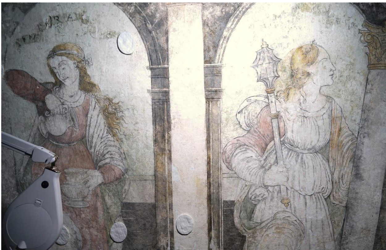
4. kép: A Mértékletesség és az Erő allegóriája (részlet)

Ugyanis csak a női lélek végtelen gazdagsága tudja megjeleníteni az Erényt, vagyis a legfőbb JÓT a társadalomban, az emberi érintkezésekben, az ember viselkedésében! Erényes lehet természetesen, a férfi is, de annak belső lelki világa, az érzelmei általában NEM jutnak annyira felszínre, vagyis láthatóvá, mint a nőknél! Sőt még az Erősség, a legfőbb JÓ négy sarokpillére egyikének is, amelyik kétségtelenül a férfi legfőbb jellemzője, annak is női alak a jelképe, aki többnyire az oroszlán, az állatok fejedelmének a legyőzőjeként jelenik meg a képzőművészeti ábrázolásokon. Esztergomban, a humanista Vitéz érsek megbízásából, az Erősség erényét jelképező fiatal lány egy hatalmas, dőlni készülő korinthoszi fejezetű márvány oszlopot tart fel a baljával, míg a jobbában buzogányt tart, amely az egyik legősibb hadi eszköz, amelynek mint hatalmi jelvénynek, szimbolikus jelentése is van. A magyar királyi jelvények egyike, a jogar is a buzogány hatalmi jelentését képviseli.