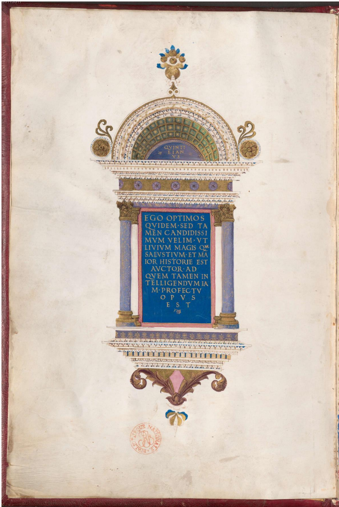
1. kép: Johannes Vitéz, Lívius-kódex, München, Bayerische Staatsbibliothek, Clm 15733. f. 1v.