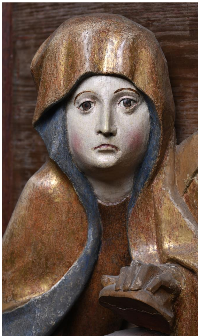
8. kép: A Garamszentbenedeki úrkoporsó hátsó oldaláról részlet: az üres sír láttán megrettent Mária döbönt arckifejezése (Esztergom, Keresztény Múzeum, Fotó: Mudrák Attila)

A fenti néhány példa erősítsen meg mindnyájunkat az önálló jellemvonásokkal bíró magyar reneszánsz művészet létezésében, amely a francia, német és az osztrák reneszánsz művészethez bizonyos hasonlatosságokat is mutat a gótikus vonások használatában, de azoktól eltér a kedvesebb, emberibb érzelmi kifejezésben, és főképpen az azoknál időben korábbi 15. századi megjelenésében.