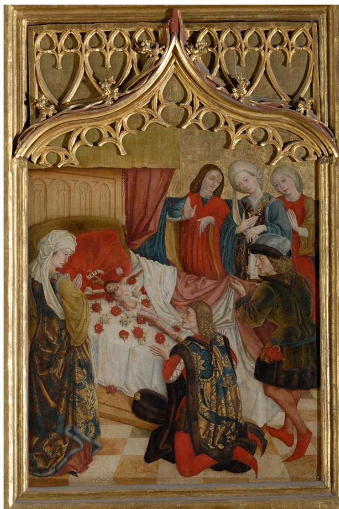
6. kép: Kassa, Szent Erzsébet Dóm, Szent Erzsébet főoltár, (15. század). Táblakép Árpád-házi Szent Erzsébet életéből vett jelenettel, az ún. leprás-csoda: Erzsébet imájára a férje ágyába fektetett beteg Megfeszített Krisztussá változik.

S amikor Lajos, Erzsébet rajongva szeretett férje hazaérkezett, a szolgák felháborodva jelentették neki az eseményt, és kérték, hogy vessen véget a felesége ilyen jellegű tevékenységének. Ezt a nem mindennapi drámai helyzetet a kassai városi tanács megbízását teljesítő jeles festőművész úgy jeleníti meg, hogy a helyszínt, a palota egyik helyiségét, a fejedelem hálószobáját a reneszánsz művészetnek az ókori Euklideszi perspektíva szabályait követve mutatja be, de magát a drámát, a szereplők érzelmi megnyilvánulását a gótikus művészet kelléktárából vett eszközökkel tárja elénk (6. kép).