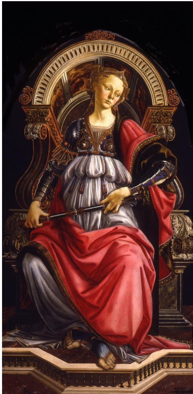
5. kép: Botticelli: Erősség allegóriája, 1470, táblakép, Firenze, Uffizi Képtár (Ltsz.:1890 n. 1606)

Az esztergomi erényeket, a legújabb művészettörténeti kutatás szerint, kétségtelenül a jeles reneszánsz festő, Botticelli festette (4. kép). S immár az is egyértelmű, hogy az Európában nagy tekintélynek örvendő Johannes Vitéz érsek hírneve révén gyorsan eljutott Firenzébe is az esztergomi humanista Studiolo pompás festészeti díszítésének a híre (4/a. kép). S ennek alapján rendelte meg Lorenzo Medici megbízottja, Tommaso Soderini a város főterén álló Mercanzia, a kereskedők céhének székháza díszterme számára az Erősség erényének allegóriáját (5. kép) az 1470-ben, többéves távollét után Firenzébe hazaérkező fiatal Sandro Mariano festőtől, akit a ragadványneven Botticelli -nek neveztek. Ezt az Uffizi képtár kiállításán látható táblaképet tartja a Botticelli szakirodalom a művész első biztos művének, tehát joggal állíthatjuk, hogy Botticelli művészi karrierje hazánkból, a Mátyás király-kori Magyar Királyságból, pontosan Esztergomból indult el a világhírnév felé. 2