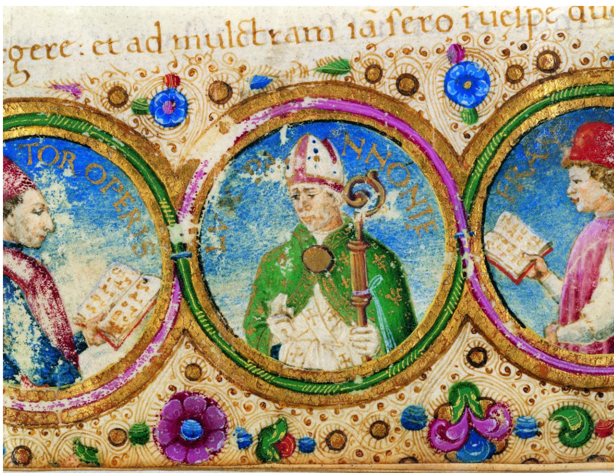
2. kép: Johannes Vitéz - Lux Pannoniae, OSZK Cod-419, Casparus Tribrachus (1439–93), Eclogae

Ezek igazolják, hogy a Magyar Királyság gazdasági-társadalmi és kulturális súlya messze jelentősebb volt, mint a kis firenzei városállamé. Onnan Magyarországra kellett jönnie egy jobb mesterembernek, hogy hírneve túlterjedjen a szülővárosa határain. Így jöttek is számosan építészek, szobrászok, festők, intarzia-mesterek, könyvmásolók, technikusok és más szakemberek, hogy jobban keressenek, híresebb emberektől kapjanak jelentősebb megbízásokat, így nagyobb hírnévre tegyenek szert.