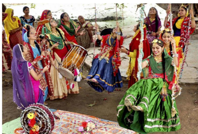
Ravi Shankar Sitar.

Dawkins, az evolúciós elmélet legnagyobb alakja, és Sheldrake, oxfordi, ill. cambridge-i professzorok, egy alkalommal leültek beszélgetni, megvitatni tudományos nézeteiket. De amikor Sheldrake azt kezdte el fejtegetni, hogy a tudat több, mint agyi aktivitás, Dawkins rövid úton véget vetett a beszélgetésnek, azzal, hogy márpedig agyon kívüli tudatformák nincsenek. – Azaz, csak csinált, művi zene van? A Világmindenség mégsem zene?