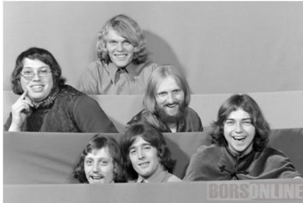
Presser Gábor – Falusi Mariann – Novák Péter: Vinnélek, vinnélek https://www.youtube.com/watch?v=oMXznC8laT8 (2024. 10. 21.)