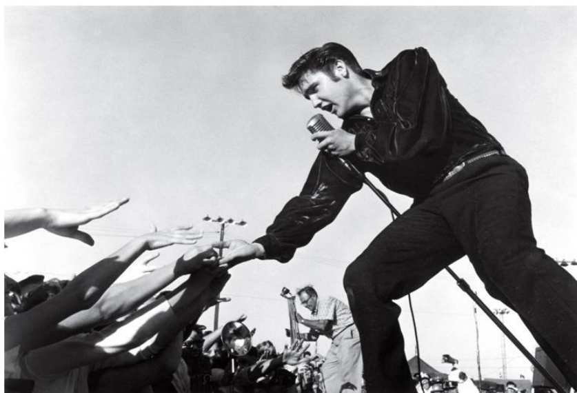
Jailhouse Rock (1957) – Elvis Presley – Classic Movie Musical Numbers https://www.youtube.com/watch?v=MfrC8PAQtIg (Letöltés: 2024. 11. 05.)