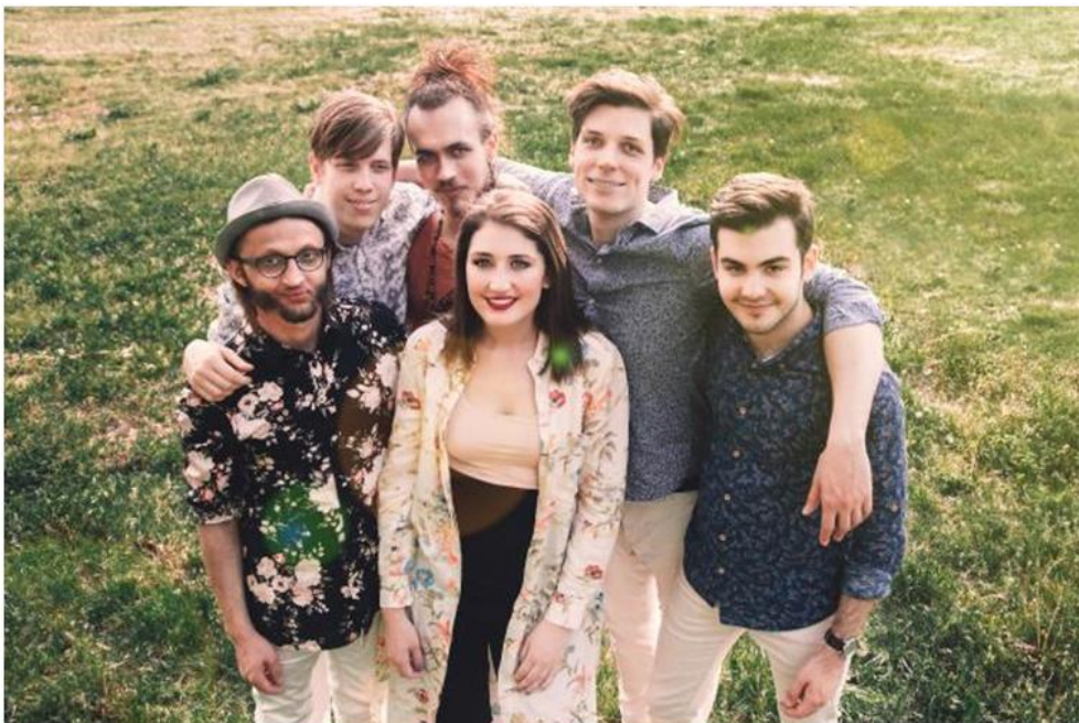
Margaret Island – Eső.

Illényi Balázs arról az ismert jelenségről ír a HVG -ben, amikor egy-egy dallam befészkel magát a fejünkbe, és szinte nem tudunk megszabadulni tőle. 35 Bármilyen zenéből kiragadhat az agy idegesítően ismételt töredékeket. Akik jobban ki vannak szolgáltatva ez idegesítő jelenségnek: a nők, a zeneileg képzetebbek és a valamilyen kényszerbetegségben szenvedők. Sejtések szerint „ezt a jelenséget a szervezet az öntudat valamiféle dinamikus szabályozására használja: a megfelelő éberségi állapot fenntartására”. Gyakorlati tanácsok, hogy hogyan lehet megszabadulni tőlük: ha az érintettek végighallgatják az egész számot, vagy ha lejátszanak egy másik dalt.