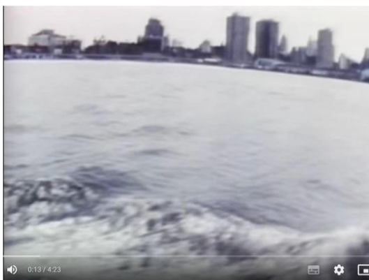
Rod Stewart – Sailing (Official HD Remastered Video)

https://www.youtube.com/watch?v=FOt3oQ_k008 (Letöltés: 2024. 11. 03.)