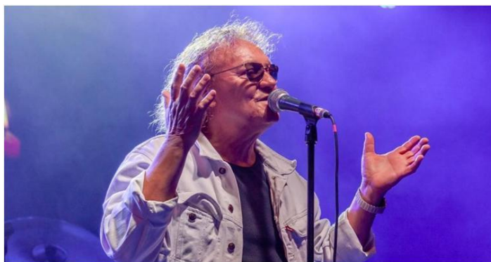
Charlie 70 – Hajnali szél – 2017

https://www.youtube.com/watch?v=sbl_w_Oe2z0 (Letöltés: 2024. 10. 30.)