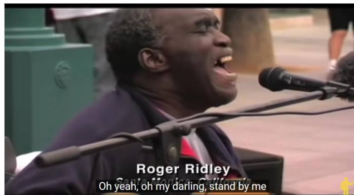
Stand By Me | Playing For Change | Song Around The World https://www.youtube.com/watch?v=Us-TVg40ExM (Letöltés: 2024. 11. 15.)