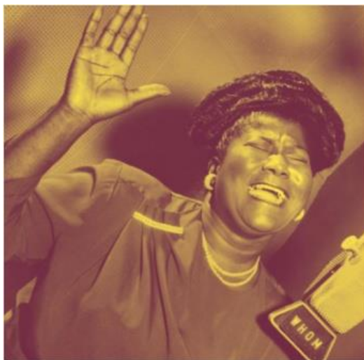
Mahalia Jackson – His Eye Is On The Sparrow

„A zenének többféle alkalmazási területe van, ahol nem veszt jellemzőiből, hanem más hasonló célú kifejezési formához társul (mozgásművészetek, színház, film, képzőművészet, irodalom), vagy pedig egy más terület veszi segítségül igénybe úgy, hogy valamelyik jellemzőjét kiemeli (sport, zeneterápia vagy diszkó, politika), de nem szünteti meg.”