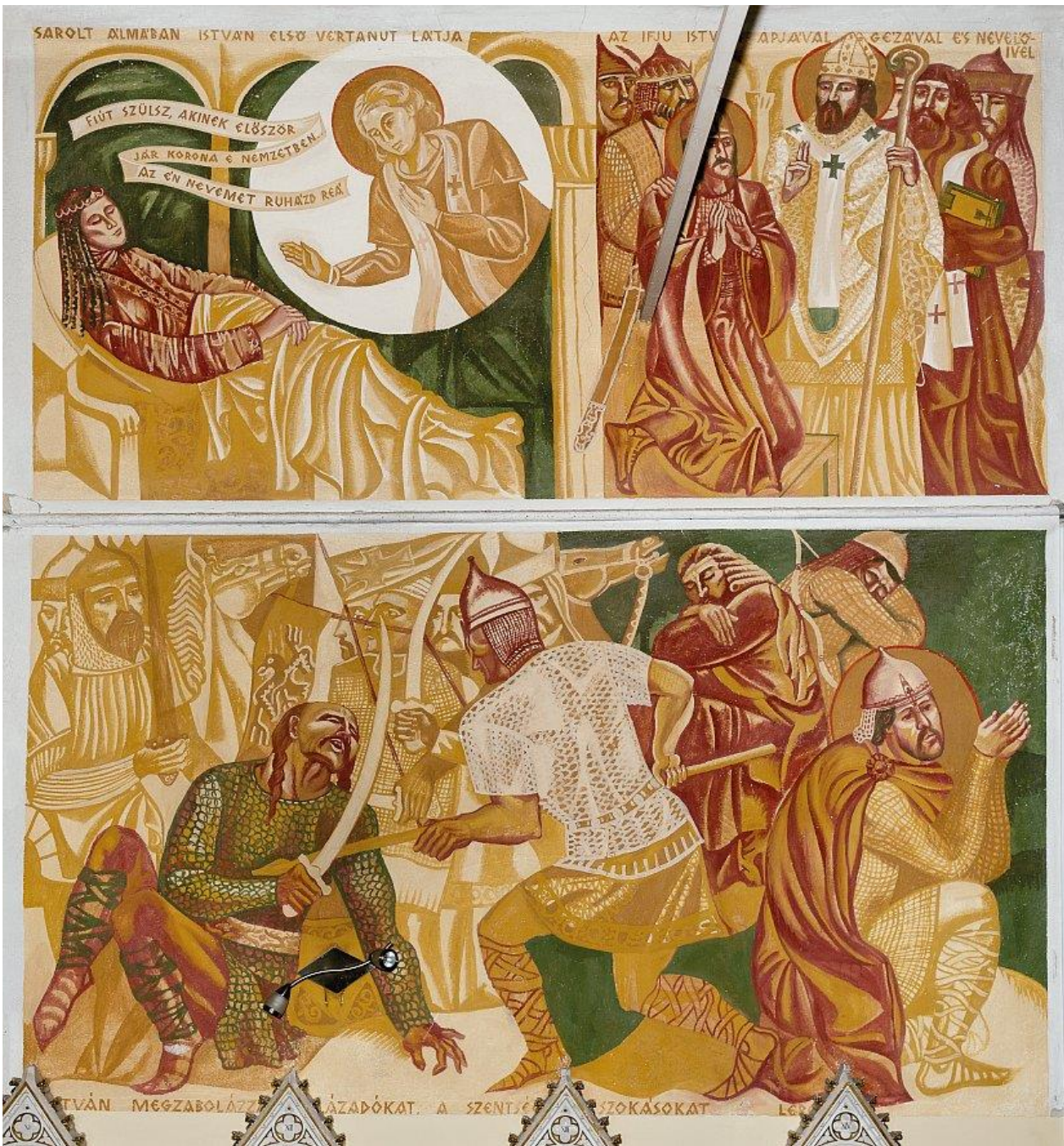
7. kép: Puskás László: Jelenetek Szent István életéből, 1981. Galvács, katolikus templom falképei

E két jelenet alatt egy összetett kompozíció készült, amely egybekapcsolja a vázlaton még különálló két csatajelenetet, valamint az ott látható, térden álló alakot. A jelenet felirata így szól: István megzabolázza a lázadókat, a szentségtelen szokásokat letöri. A képen baloldalt lovas katonák összecsapását ábrázoló csatajelenet bontakozik ki. Jelentésére a zászlók utalnak, a turulos zászló rúdja eltörött, föléje emelkedik győztesen egy kereszttel díszített lobogó. A csata előterében egy pogány magyar, minden bizonnyal Koppány esik össze egy sisakos vitéz lándzsaszúrásától. A jobbra látható sisakos, páncélinge fölött palástot viselő lovagban dicsfénye révén Szent Istvánt ismerhetjük fel, aki féltérde ereszkedve, imára emeli kezeit, mögötte sebesült katonák alakjai.