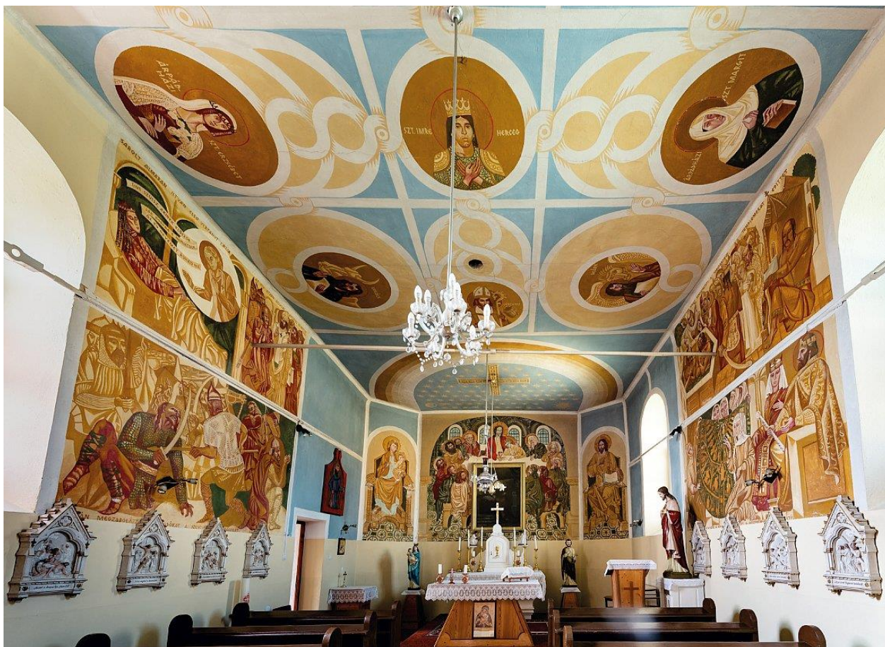
5. kép: Puskás László: A galvácsi Szent István király katolikus templom falképei, 1981

A templom enteriőrje nagyon egyszerű, egyetlen hosszanti, síkmennyezetes tér. Két keleti sarka lemetszett, ezek a ferde, keskeny falszakaszok keretezik a szentély záró falát. A hajó jobb oldalán három félköríves ablak nyílik, baloldalt csak középen és hátul van ablak, elől a szentélynél ajtó vezet a templom oldalához épített sekrestyébe. Az épületbelsőben a statikai problémákból adódó falmozgás megakadályozására utólag vas traverzeket építettek be a falak mentén és a hajó közepén keresztbe.